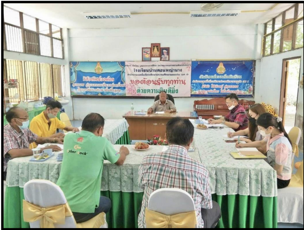
รูปภาพที่ ๑ การประชุมคณะกรรมการสถานศึกษา ประจำปี พ.ศ.๒๕๖๕