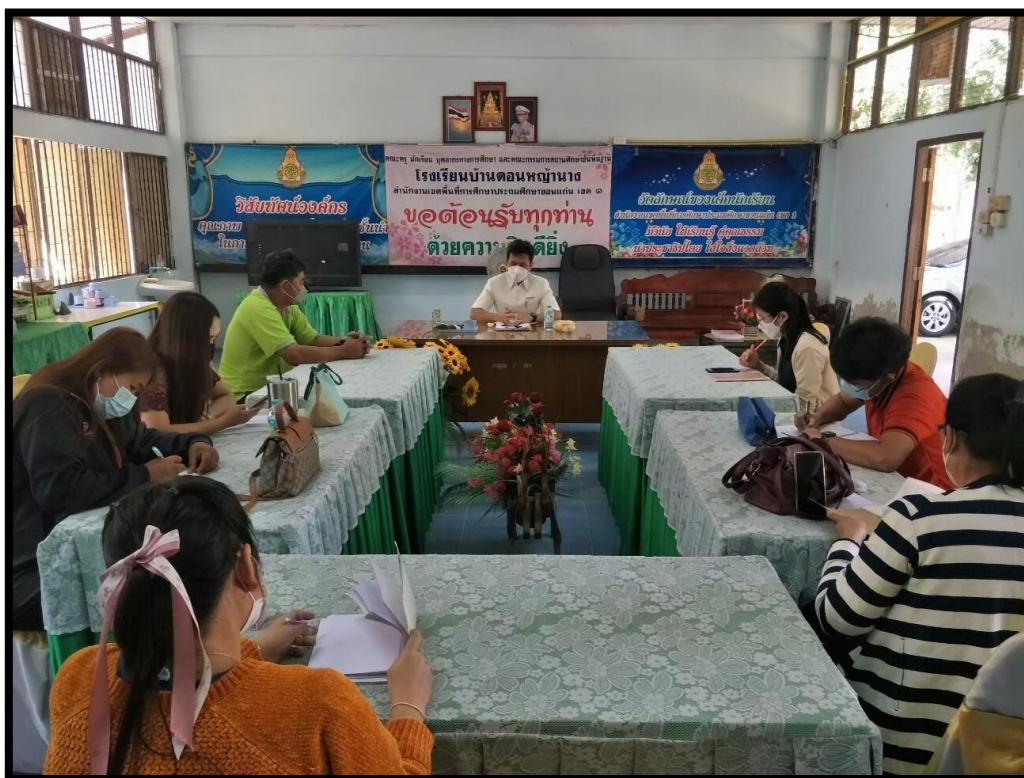
รูปภาพที่ ๒ การประชุมคณะครูและบุคลากรโรงเรียน ประจำปี พ.ศ.๒๕๖๕